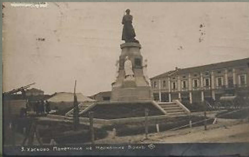
3. Хасково. Паметник на неизвестния войн